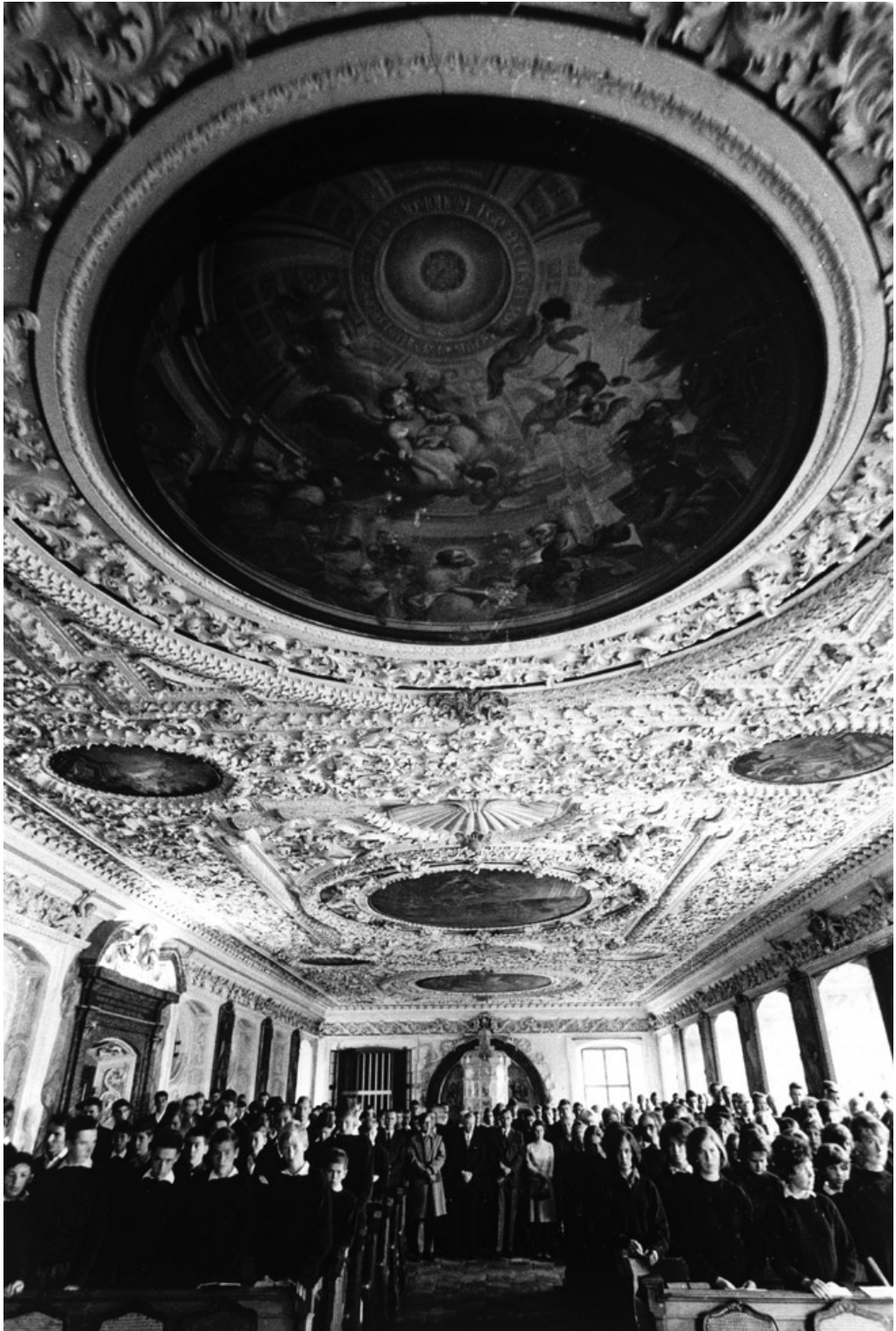
Morgenandacht in Schule Schloß Salem. 1963. Will McBride