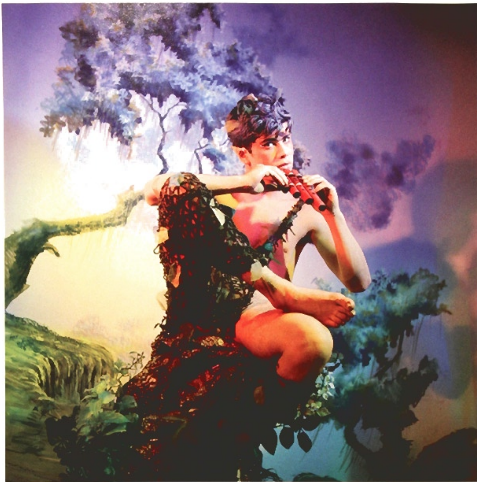
詹姆斯·比德格得，《潘》（James Bidgood, Pan ），摄影，1960年代后期。