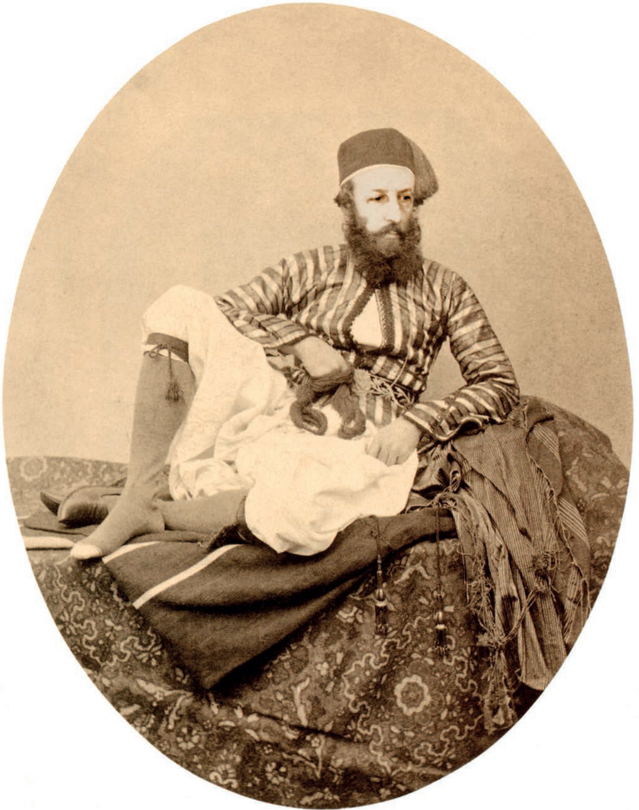
Chuck Samuels. After Frith, The Photographer series, 2015.