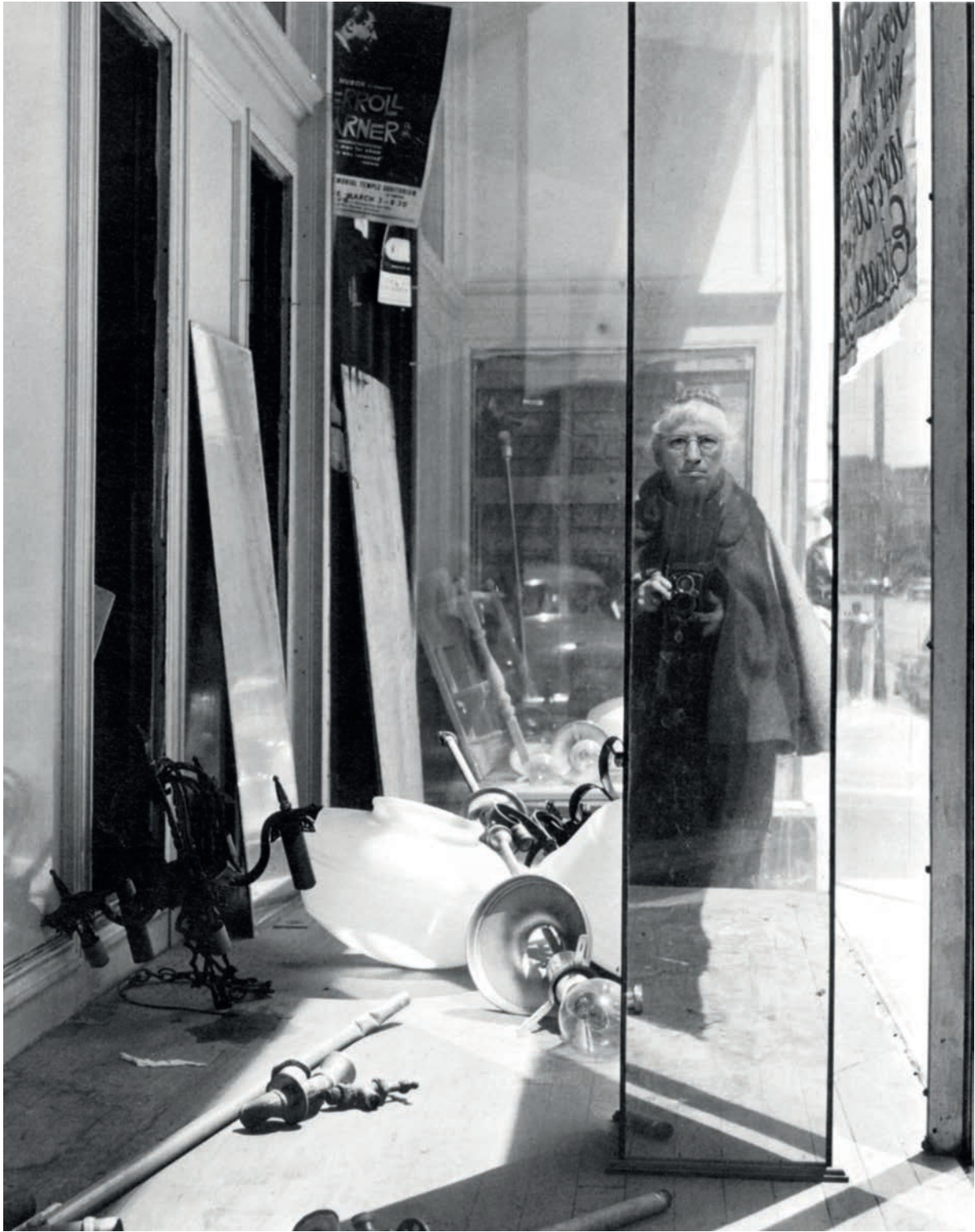
Chuck Samuels. After Cunningham , The Photographer series, 2015.